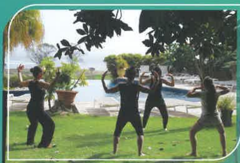
Dans notre jardin 8 € / personne (1h)

Amélioration du sommeil Réduction du stress Détente corporelle Calme mental Augmentation de l'énergie